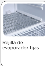
Rejilla de evaporador fijas