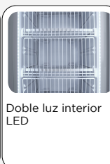
Doble luz interior LED