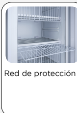
Red de protección