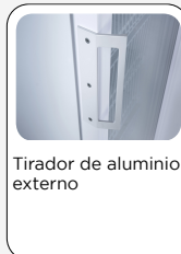
Tirador de aluminio externo