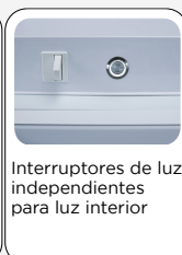
Interruptores de luz independientes para luz interior