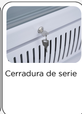
Cerradura de serie